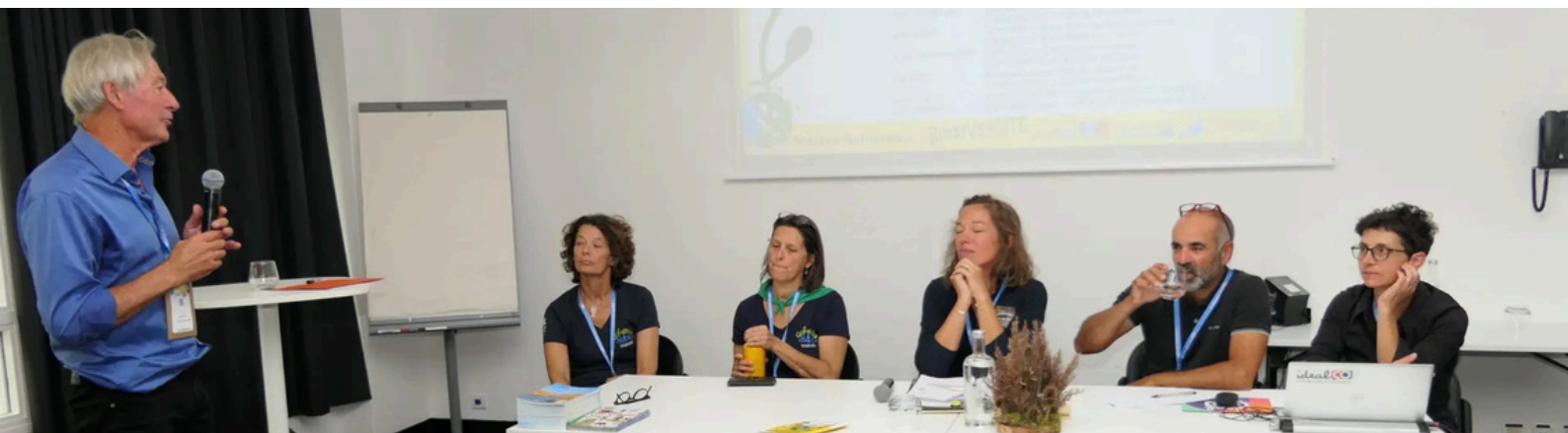
ATELIER / Mieux accueillir pour mieux préserver

Les congressistes se sont montrés gourmands d'informations et de retours d'expériences , volontiers participatifs lors des débats nourris ponctuant les ateliers bondés, dont ceux animés par Rivages de France (lire ci-après). Autre franc succès, celui de l'espace expo et rencontre accueillant les stands des partenaires institutionnels et associatifs (dont Rivages de France !)