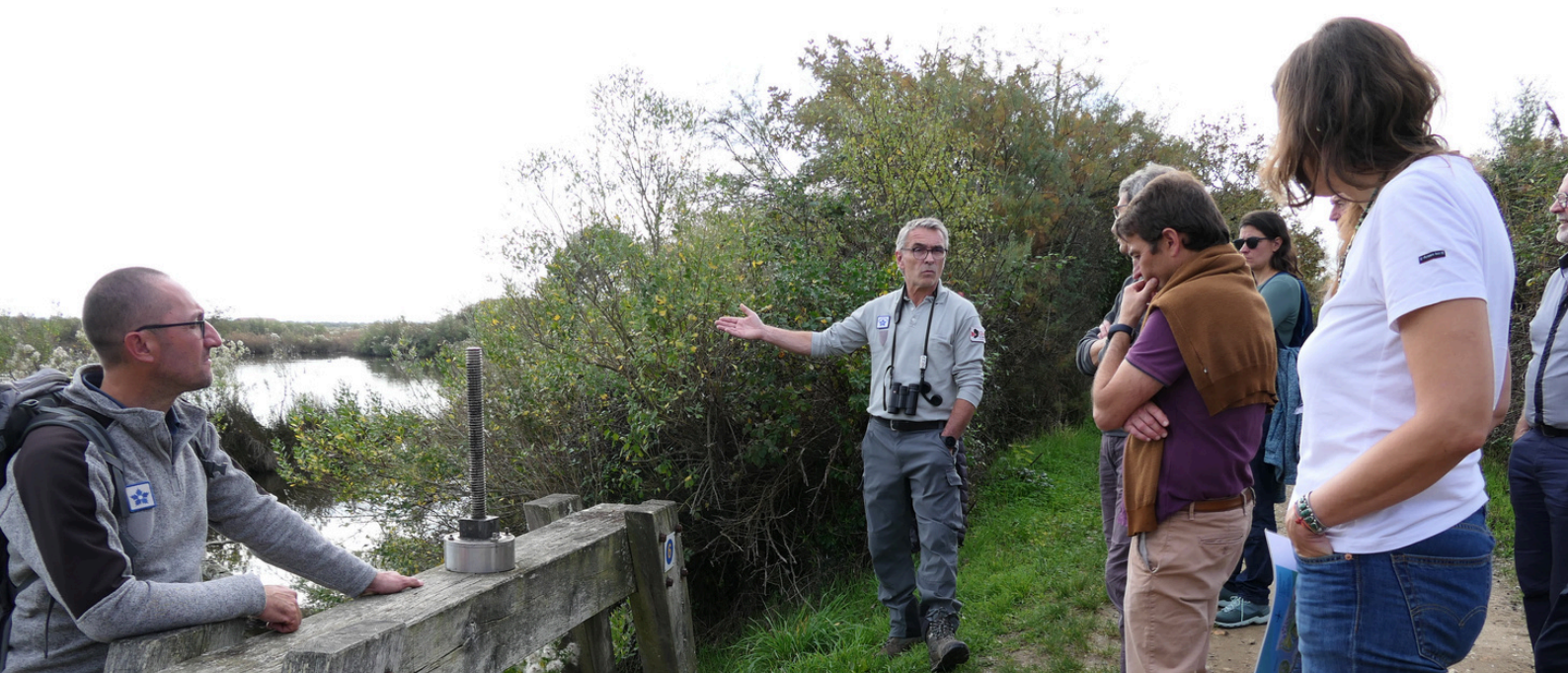
Sur les sentiers du Domaine de Graveyron : visite guidée par les équipes du Département de Gironde et du Conservatoire du littoral