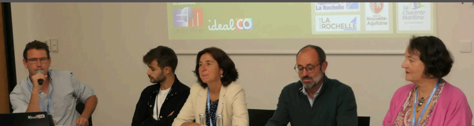
ATELIER A6 / Renforcer la résilience des milieux côtiers à travers la continuité terre-mer