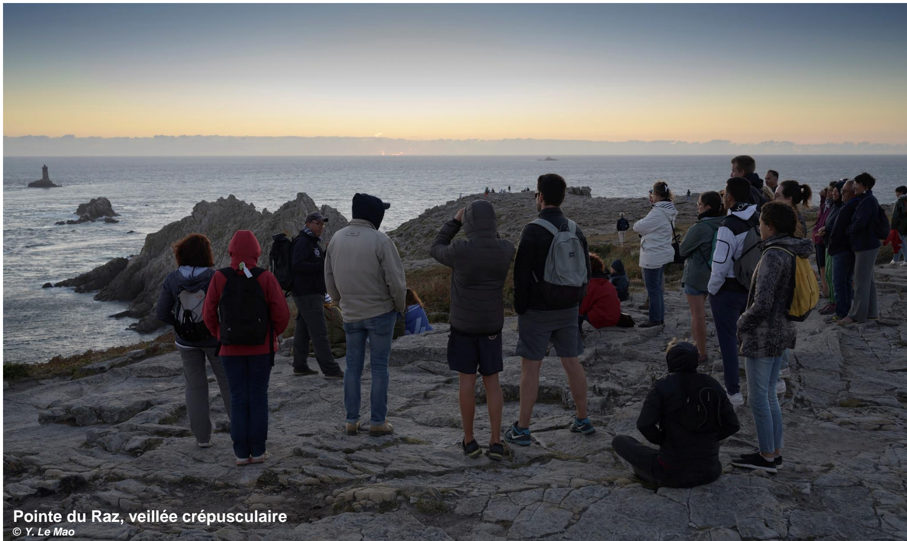
Pointe du Raz, veillée crépusculaire