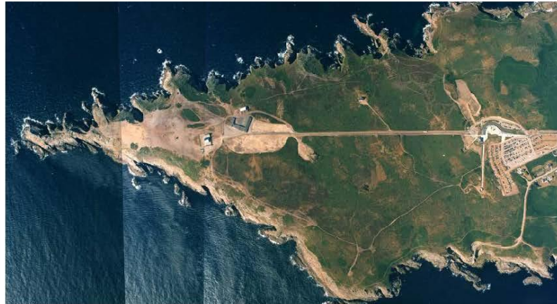
Pointe du Raz avant réaménagement