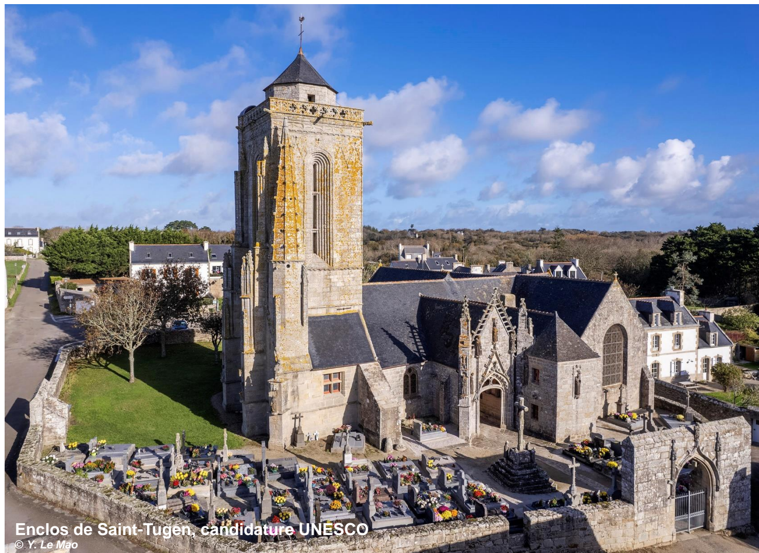
Enclos de Saint-Tugen, candidature UNESCO