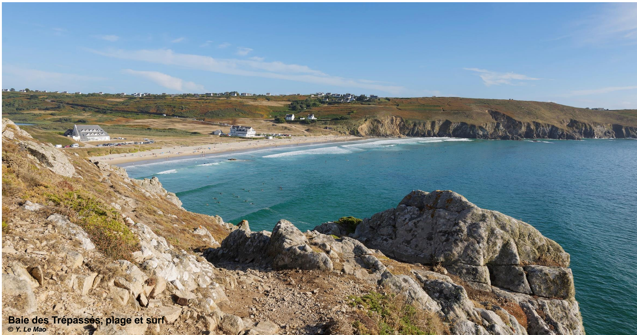
Baie des Trépassés, plage et surf