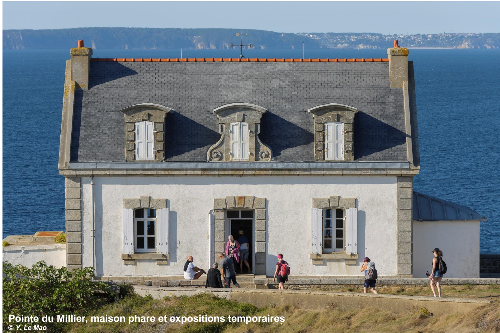
Pointe du Millier, maison phare et expositions temporaires