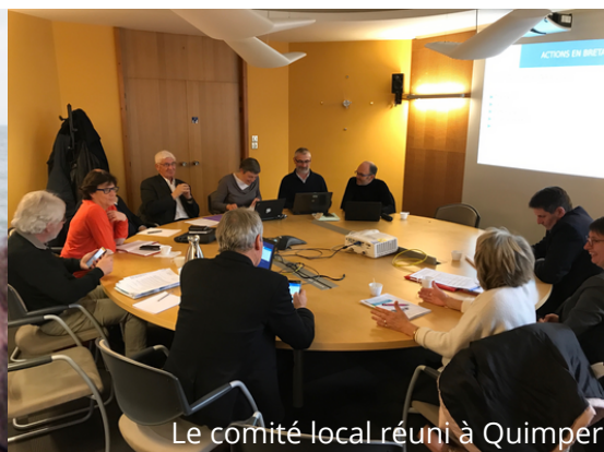
Le comité local réuni à Quimper